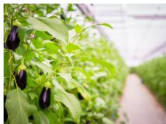
Managementinformatie en arbeidsregistratie