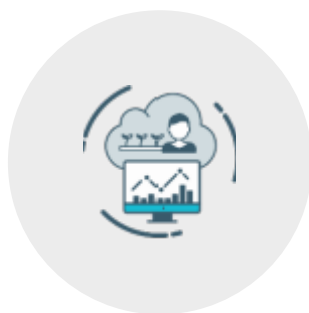
Eenvoudig beheer van uw gebouwklimaat