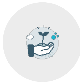
Slim energie besparen