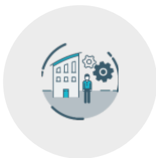
Precieze regeling van het gebouwklimaat